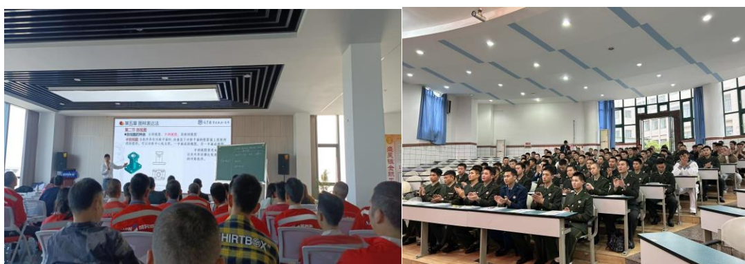
图 6 开展精准培训

隆昌城关职业中学致力于技能人才核心能力的培育，紧密结合社会服务需求，构建了“赛-证-训”融合发展的体系，借助多元化实践提升育人质量与服务效能。一是以竞赛促进学习，通过多层级竞赛展现技能实力。在国家级赛事层面，该校荣获中国“芯”助力中国梦全国青少年通信科技创新大赛一等奖 1 项、二等奖 7 项；在省部级赛事中，5 名学生于 2024 年“中银杯”四川省职业院校技能大赛中获得三等奖；在地市级赛事里，累计获得超过 140 项奖项，超 150 人次的学生参与其中，通过竞赛检验并提升专业技能。二是以证书赋予能力，通过专项考证夯实就业基础。针对应急消防人才的需求，43 名学生参加消防设施操作员职业技能等级认证，全部考取中级（X）证书，通过率达 100%，通过“课程-考证-岗位”的有效衔接，为区域消防行业输送合格人才。三是开展精准培训以契合社会需求。对接企业与特殊群体的需求，开展 25 场“点单式”企业培训，深入企业定制课程，培训职工 395 人；为 105 名退役军人开展适应性培训，联合 12 家企业提供实习岗位，履行职业教育服务社会的使命。