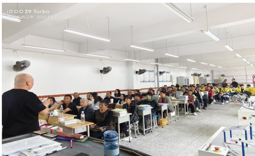
图 3 家校共育活动

四川省隆昌市城关职业中学成功举办了一场家校共育活动，该活动的目的在于加强学校与家庭之间的沟通，促进学生的成长。在活动筹备阶段，学校进行了精心的安排，对校园环境进行了清扫与整理，布置了接待区域，并针对家长可能关注的问题做了充分准备。活动开展期间，各个班级依据自身专业特色对教室进行了布置。例如，数字影像技术专业展示了学生的相关作品，电子商务专业设置了“班级荣誉榜”，以此营造出浓厚的职业教育氛围。部分班级还设置了颁奖环节，以增强学生的成就感。在家校交流环节，班主任向家长介绍了学校的办学理念、专业建设情况以及学生的升学和就业前景，并结合学生的具体表现提出了家校协作的建议。家长们与教师进行了深入的沟通，共同探讨了孩子的成长路径。此次活动有效地增进了学校与家庭之间的理解与信任，为学生的成长搭建了坚实的桥梁。