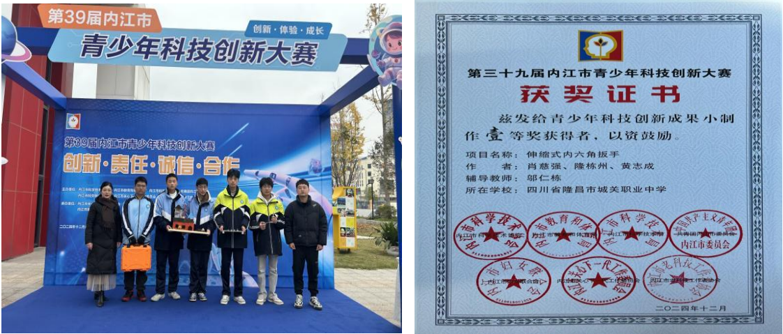
图 5 学生竞赛及获奖

学校聚焦应急消防领域人才需求，组织 43 名学生参加消防设施操作员职业技能等级认证，全部考取中级消防设施操作员证书，通过率 100%，通过“课程-考证-岗位”衔接，为区域消防行业输送合格人才。全校学生整体素质见表 1-8、表 1-9 所示。