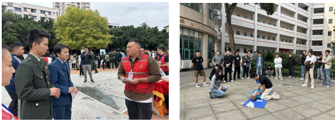
图 7 开展社会培训服务区域发展

四川省隆昌市城关职业中学为服务区域经济与社会发展，构建多元化服务体系，对接企业职工与退役军人需求，成效显著。一是创新“点单式”培训，破解企业“工学矛盾”。学校深入盛昊钣金等企业调研，定位能力缺口，开设定制课程。组建师资团队，采用“线上预习+线下研讨”“送教入企+在岗辅导”模式，全年开展培训 25 场，覆盖职工 395 人，实现技能提升与企业生产衔接。二是开展“适应性”培训，助力退役军人职场转型。学校全年培训退役军人 105 人，课程含通用技能与区域紧缺技术。通过邀请创业典型分享、联动企业提供实习，助其适应职场、就业创业。学校彰显社会价值，为地方经济社会发展提供支撑。