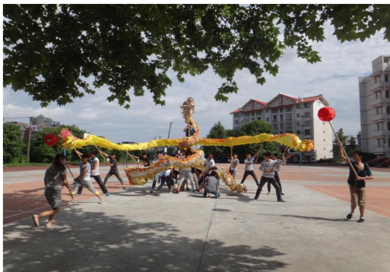
图 10 舞龙队训练