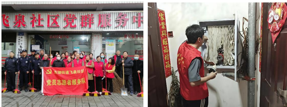
图 8 学校党总支服务社区