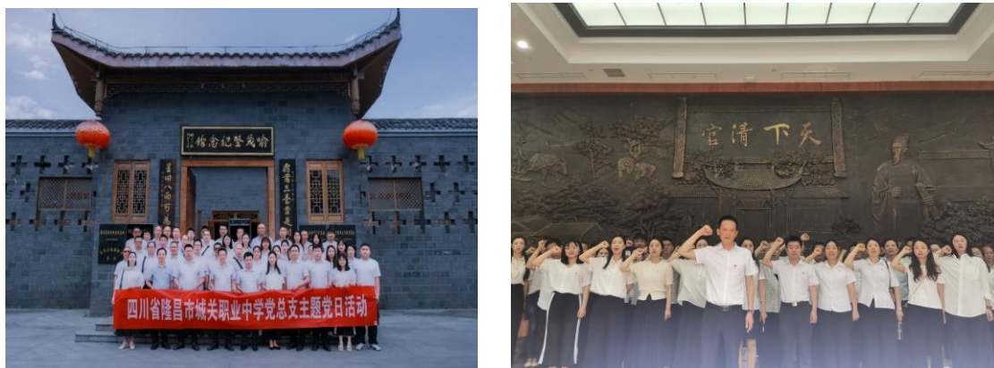
图 9 参加主题党日活动

为进一步深化党风廉政建设，强化党员干部的党纪意识、规矩意识以及廉洁自律意识，四川省隆昌市城关职业中学党总支组织全校党员、入党积极分子以及非党员行政干部，前往重庆荣昌区喻茂坚纪念馆，开展了以“清风扬正气 廉心铸党魂”为主题的党日活动。活动开展前，教师们主动查阅家风家规相关资料，针对廉洁家风建设、党员干部如何传承优良家风等议题展开了深入探讨，并表示要将廉洁自律理念融入日常工作与生活。活动期间，全体人员通过实地参观学习，直观领略了廉政文化的魅力；在研讨交流阶段，大家踊跃发言，思想交流活跃。活动结束后，全体教师 在纪念馆门口整齐列队，重温入党誓词，铿锵有力的誓言回荡在现场，展现出对党的忠诚和为党事业奋斗的坚定意志。此次主题党日活动形式多样、内容充实，使全体参与人员接受了一场深刻的廉政文化教育。