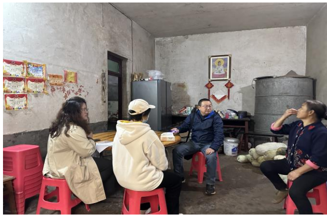
图 4 走访慰问生病学生

校领导”三级联动机制，对学生的身心状况与家庭困境进行精准评估；二是构建“经济+心理+同伴”立体支持体系，组织师生开展爱心募捐活动，由班主任、心理教师与同学共同给予情感陪伴，维护学生的尊严与信心；三是深化家校协同合作，持续就学生病情与恢复进展情况进行沟通，形成育人合力；四是将个案转化为教育资源，通过国旗下讲话、主题班会等形式宣传学生的责任意识与生命韧性，引导全体学生对生命价值进行思考。该机制在应对本校 2024 级一名患有重度颌面部肿瘤学生的突发手术处理中成效显著。