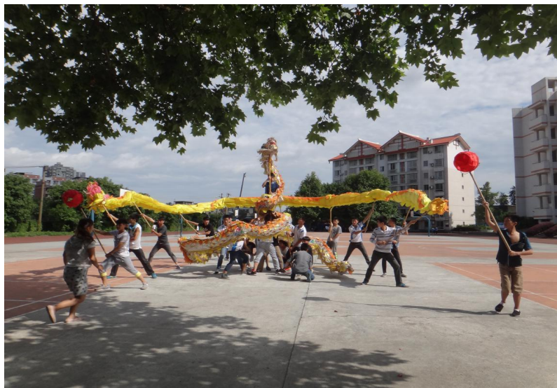
图 10 舞龙队训练