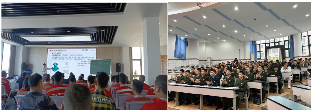
图 6 开展精准培训

隆昌城关职业中学致力于技能人才核心能力的培育，紧密结合社会服务需求，构建了“赛-证-训”融合发展的体系，借助多元化实践提升育人质量与服务效能。一是以竞赛促进学习，通过多层级竞赛展现技能实力。在国家级赛事层面，该校荣获中国“芯”助力中国梦全国青少年通信科技创新大赛一等奖 1 项、二等奖 7 项；在省部级赛事中，5 名学生于 2024 年“中银杯”四川省职业院校技能大赛中获得三等奖；在地市级赛事里，累计获得超过 140 项奖项，超 150 人次的学生参与其中，通过竞赛检验并提升专业技能。二是以证书赋予能力，通过专项考证夯实就业基础。针对应急消防人才的需求，43 名学生参加消防设施操作员职业技能等级认证，全部考取中级（X）证书，通过率达 100%，通过“课程-考证-岗位”的有效衔接，为区域消防行业输送合格人才。三是开展精准培训以契合社会需求。对接企业与特殊群体的需求，开展 25 场“点单式”企业培训，深入企业定制课程，培训职工 395 人；为 105 名退役军人开展适应性培训，联合 12 家企业提供实习岗位，履行职业教育服务社会的使命。