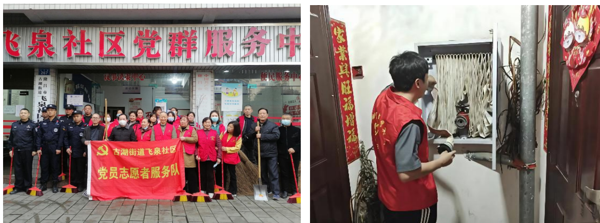
图 8 学校党总支服务社区