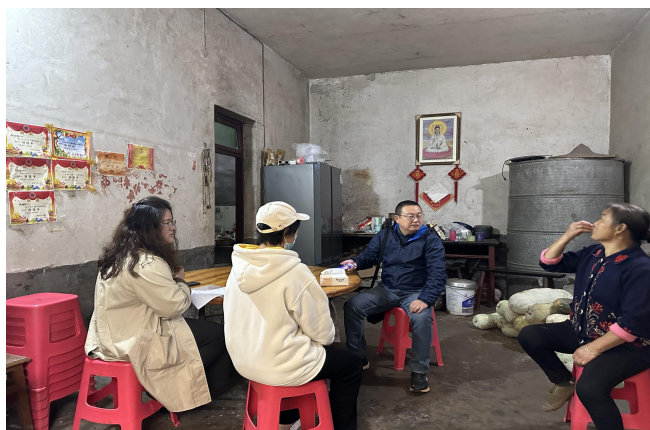
图4 走访慰问生病学生

对突发状况构建快速响应与精准帮扶机制。一是制定“班主任—政教处—校领导”三级联动机制，对学生的身心状况与家庭困境进行精准评估；二是构建“经济+心理+同伴”立体支持体系，组织师生开展爱心募捐活动，由班主任、心理教师与同学共同给予情感陪伴，维护学生的尊严与信心；三是深化家校协同合作，持续就学生病情与恢复进展情况进行沟通，形成育人合力；四是将个案转化为教育资源，通过国旗下讲话、主题班会等形式宣传学生的责任意识与生命韧性，引导全体学生对生命价值进行思考。该机制在应对本校2024级一名患有重度颌面部肿瘤学生的突发手术处理中成效显著。